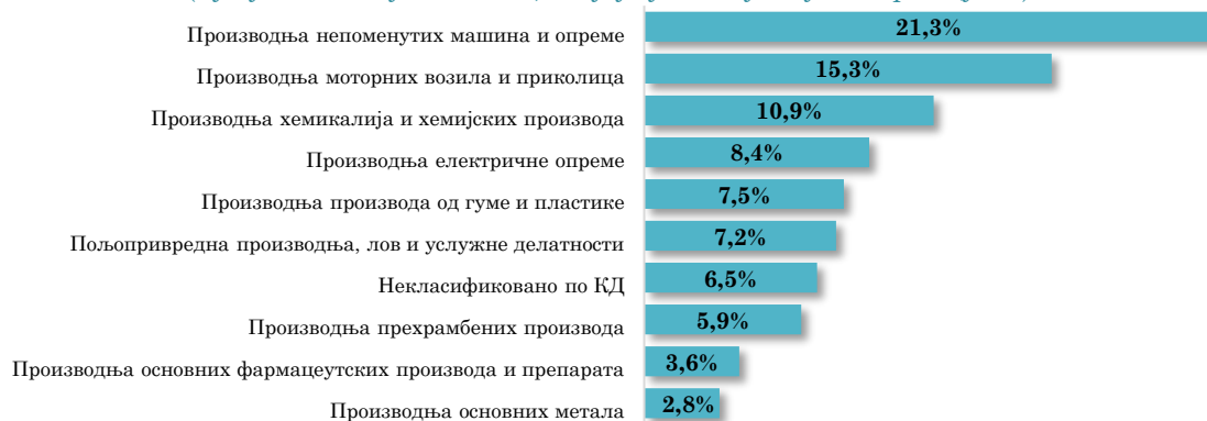
Водеће делатности у увозу АП Војводине из Француске, I-XI 2024. (кумулативно учешће 89,3% у укупном увозу из Француске)

Посматрано по артиклима, у АП Војводини је из Француске у посматраном периоду највише увезено Делова пумпи за течности, за осталу употребу , у вредности 25,3 млн евра (10,1%) , што је за 14,2% више него у истом периоду 2023. године, при чему је 61,8% укупног војвођанског увоза овог артикла увезено управо из Француске.