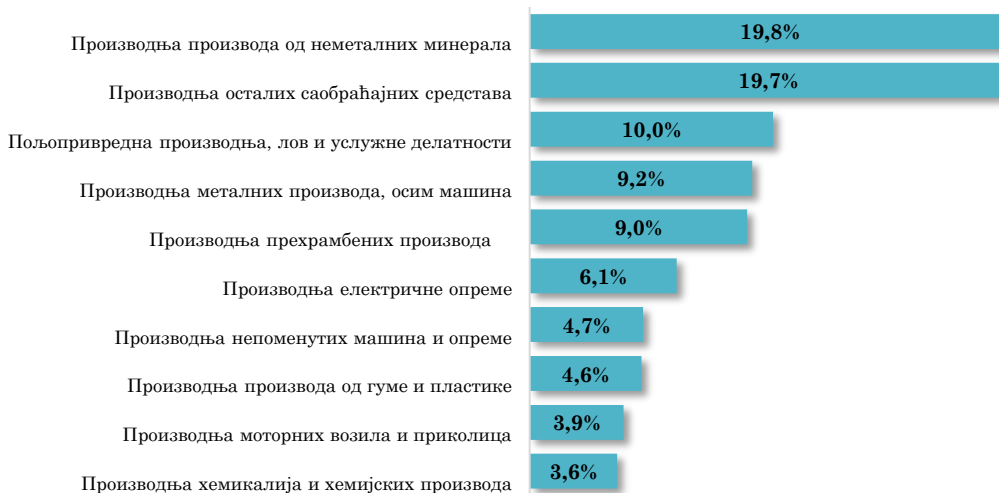
Водеће делатности у извозу АП Војводине у Аустрију, јануар - новембар 2024. (кумулативно учешће 90,5% у укупном извозу у Аустрију)

Уколико се извоз АП Војводине у Републику Аустрију посматра по артиклима, на првом месту се налази извоз Осталих бродова и пловила, за превоз робе, путника , који је у периоду јануар - новембар 2024. године износио 40,1 млн евра и чинио 19,3% укупног извоза АП Војводине у Аустрију , што представља 58,8% укупног војвођанског извоза овог артикла . На другом месту налази се извоз Осталих производа, од стакла , који је у једанаест месеци 2024. године износио 32 млн евра , а Војводина га је у готово у потпуности пласирала на тржиште Аустрије. На трећем месту налази се извоз кукуруза , који је са вредношћу од 15,8 млн евра скоро пет пута већи од оствареног извоза у истом периоду 2023. године.