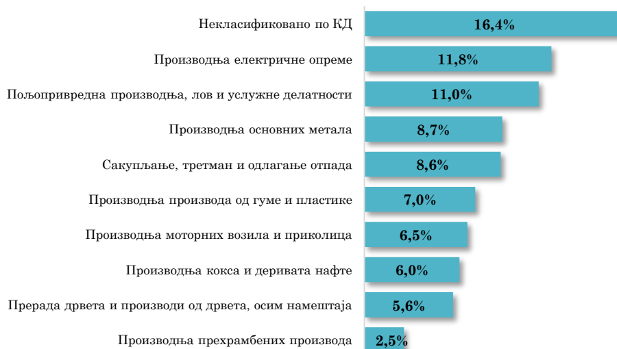
Водеће делатности у увозу АП Војводине из Румуније, I-IV 2024. (кумулативно учешће 84,1% у укупном војвођанском увозу из Румуније)

Посматрано по областима делатности, у увозу АП Војводине из Румуније, поред области Некласификовано по КД (16,4% учешће у прва четири месеца 2024. године), највеће учешће има област прерађивачке индустрије, односно Производња електричне опреме , од 11,8% (која је забележила међугодишње повећање вредности увоза за 13,1%) и област пољопривреде, односно Пољопривредна производња, лов и услужне делатности , од 11,0% (која је остварила међугодишње повећање вредности увоза за 13,9%).