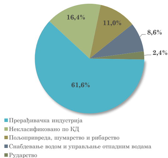
Структура увоза АП Војводине из Румуније, јануар - април 2024.

Посматрано по областима делатности, у увозу АП Војводине из Румуније, поред области Некласификовано по КД (16,4% учешће у прва четири месеца 2024. године), највеће учешће има област прерађивачке индустрије, односно Производња електричне опреме , од 11,8% (која је забележила међугодишње повећање вредности увоза за 13,1%) и област пољопривреде, односно Пољопривредна производња, лов и услужне делатности , од 11,0% (која је остварила међугодишње повећање вредности увоза за 13,9%).