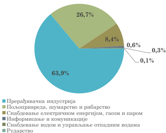
Структура извоза Републике Србије у Румунију, јануар - април 2024.