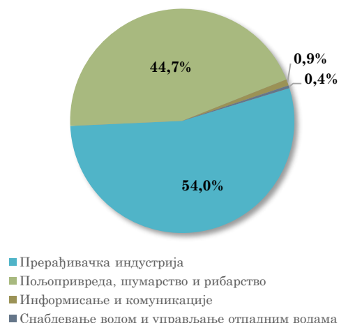
Структура извоза АП Војводине у Румунију, јануар - април 2024.

Посматрано по областима делатности, највеће учешће у извозу АП Војводине у Румунију има област пољопривреде, односно Пољопривредна производња, лов и услужне делатности (44,7% укупног војвођанског извоза у Румунију у прва четири месеца 2024. године), која је остварила четири пута већу вредност извоза у односу на исти период прошле године. На другом месту налази се област прерађивачке индустрије, односно Производња моторних возила и приколица , која чини 13,4% укупног војвођанског извоза у Румунију у посматраном периоду и која је остварила међугодишње смањење вредности извоза за 15,3% .