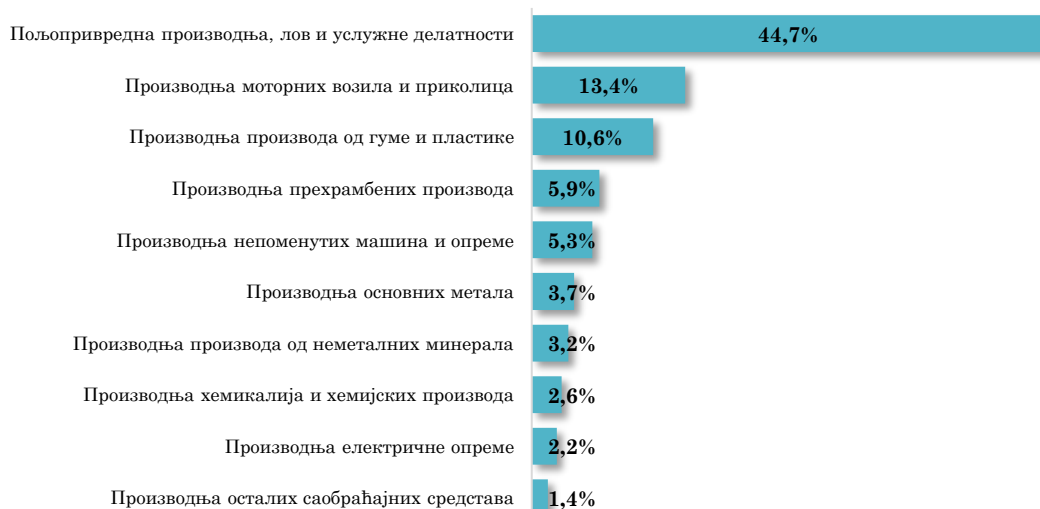
Водеће делатности у извозу АП Војводине у Румунију, I-IV 2024. (кумулативно учешће 93,0% у укупном војвођанском извозу у Румунију)

Посматрано по областима делатности, највеће учешће у извозу АП Војводине у Румунију има област пољопривреде, односно Пољопривредна производња, лов и услужне делатности (44,7% укупног војвођанског извоза у Румунију у прва четири месеца 2024. године), која је остварила четири пута већу вредност извоза у односу на исти период прошле године. На другом месту налази се област прерађивачке индустрије, односно Производња моторних возила и приколица , која чини 13,4% укупног војвођанског извоза у Румунију у посматраном периоду и која је остварила међугодишње смањење вредности извоза за 15,3% .