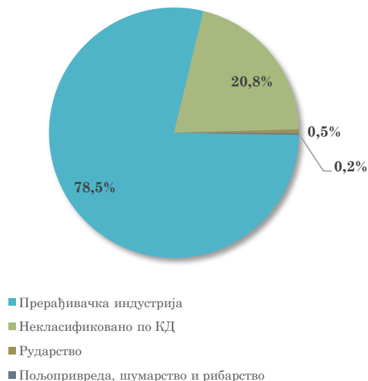
Структура увоза АП Војводине из Белгије, јануар - мај 2024. године

Посматрано по областима делатности, у укупном увозу АП Војводине из Белгије, у првих пет месеци ове године, највећи је био увоз области Некласификовано по КД (учешће 20,8% ), који је у односу на исти период прошле године био већи за 13,9% . Следи увоз области прерађивачке индустрије, и то, Производња хемикалија и хемијских производа (18,9% укупног увоза из Белгије, а за 17,0% више мг.), Производња прехранбених производа (учешће 15,4%, а за 16,6% више мг.), Производња моторних возила и приколица (учешће 15,3%, а за 32,0% више мг.).