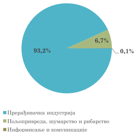
Структура извоза Србије у Белгију, јануар - мај 2024. године