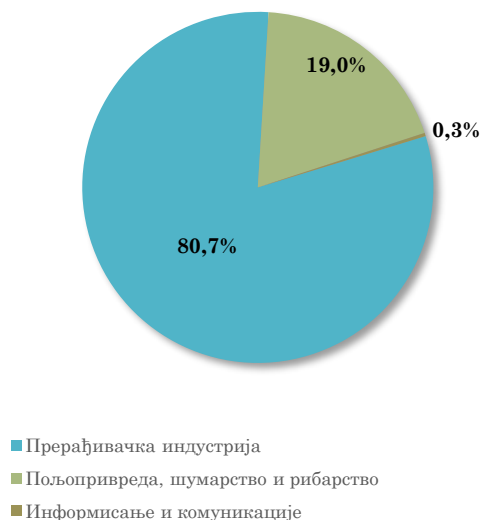
Структура извоза АП Војводине у Белгију, јануар - мај 2024. године

Посматрано по областима делатности, највеће учешће у извозу АП Војводине у Белгију има Производња текстила (19,7%) , затим Пољопривредна производња, лов и услужне делатности (19,0%) , Производња моторних возила и приколица (14,8%) и Производња основних фармацеутских производа и препарата (13,8%) укупног војвођанског извоза у Белгију у првих пет месеци 2024. године).