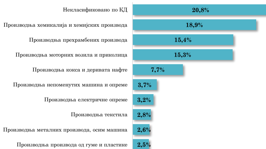
Водеће делатности у увозу АП Војводине из Белгије, јануар - мај 2024. (кумулативно учешће 92,9% у укупном увозу из Белгије)

Посматрано по областима делатности, у укупном увозу АП Војводине из Белгије, у првих пет месеци ове године, највећи је био увоз области Некласификовано по КД (учешће 20,8% ), који је у односу на исти период прошле године био већи за 13,9% . Следи увоз области прерађивачке индустрије, и то, Производња хемикалија и хемијских производа (18,9% укупног увоза из Белгије, а за 17,0% више мг.), Производња прехранбених производа (учешће 15,4%, а за 16,6% више мг.), Производња моторних возила и приколица (учешће 15,3%, а за 32,0% више мг.).