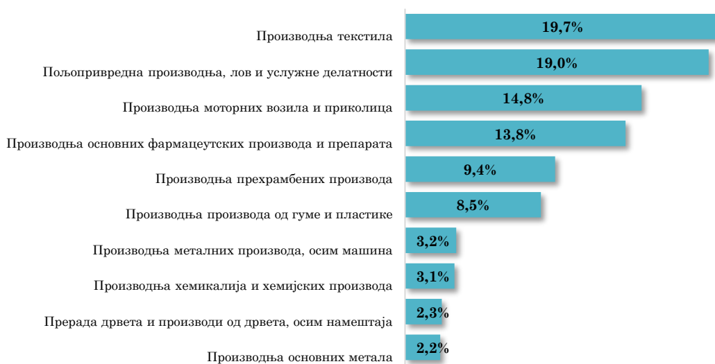
Водеће делатности у извозу АП Војводине у Белгију, јануар - мај 2024. (кумулативно учешће 96% у укупном извозу у Белгију)

Посматрано по областима делатности, највеће учешће у извозу АП Војводине у Белгију има Производња текстила (19,7%) , затим Пољопривредна производња, лов и услужне делатности (19,0%) , Производња моторних возила и приколица (14,8%) и Производња основних фармацеутских производа и препарата (13,8%) укупног војвођанског извоза у Белгију у првих пет месеци 2024. године).