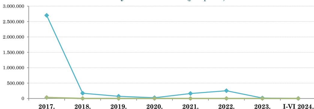
Спољнотрговинска робна размена АП Војводине и Републике Анголе (у еврима)

Од почетка 2024. године није забележена спољнотрговинска робна размена између АП Војводине и Републике Анголе , док је у протеклој 2023. години укупна размена износила непуних 16 хиљада евра и била је за 89,9% мања од размене забележене 2022. године (када је износила непуних 250 хиљада евра).