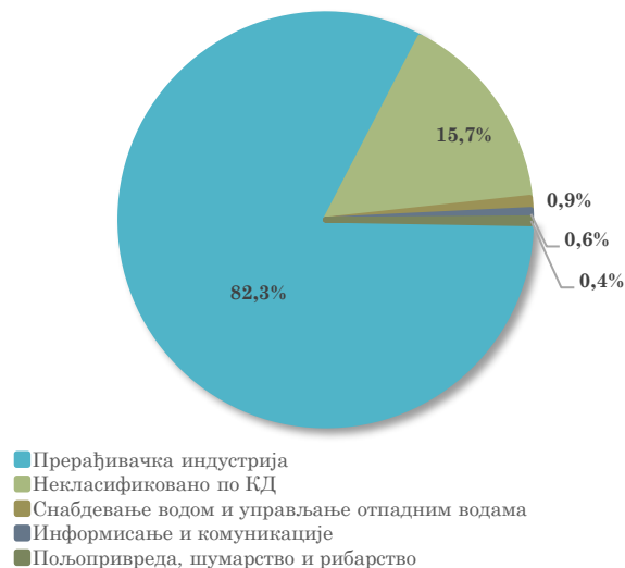
Структура увоза АП Војводине из Републике Словеније, јануар - март 2023.

Посматрано по областима делатности, у увозу АП Војводине из Републике Словеније највеће учешће има област Производња електричне опреме (18,0% укупног војвођанског увоза из Републике Словеније у прва три месеца 2023. године). На другом месту је увоз области Некласификовано по КД , који чини 15,7% укупног војвођанског увоза из Словеније у посматраном периоду. Преостале области делатности, у групи од првих десет у увозу АП Војводине из Словеније, чине области сектора прерађивачке индустрије.