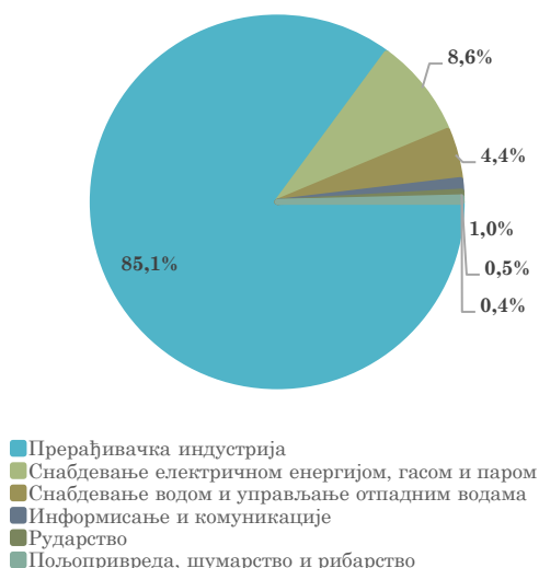
Структура извоза Србије у Словенију, јануар - март 2023.