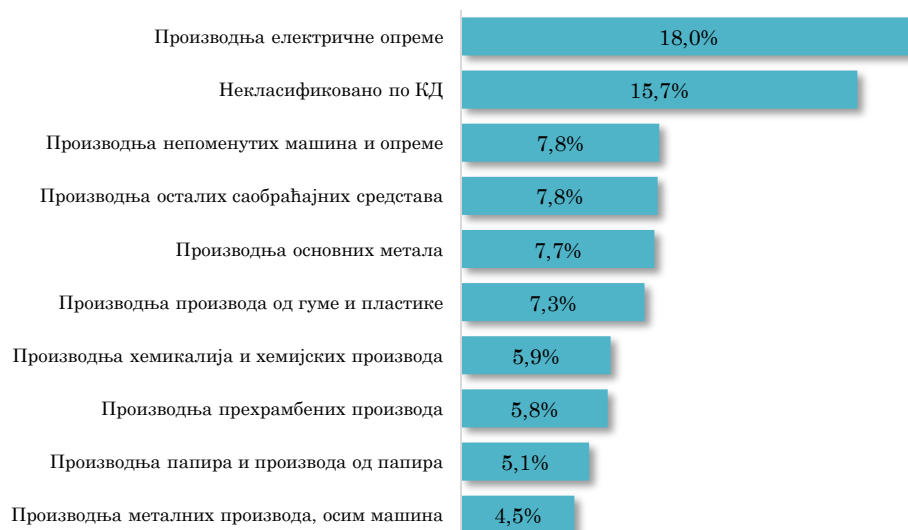
Водеће делатности у увозу АП Војводине из Словеније, јануар - март 2023. (кумулативно учешће 85,5% у укупном војвођанском увозу из Словеније)

Посматрано по областима делатности, у увозу АП Војводине из Републике Словеније највеће учешће има област Производња електричне опреме (18,0% укупног војвођанског увоза из Републике Словеније у прва три месеца 2023. године). На другом месту је увоз области Некласификовано по КД , који чини 15,7% укупног војвођанског увоза из Словеније у посматраном периоду. Преостале области делатности, у групи од првих десет у увозу АП Војводине из Словеније, чине области сектора прерађивачке индустрије.