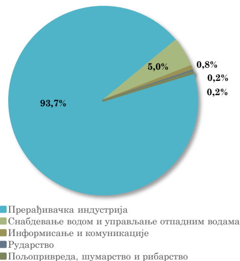
Структура извоза АП Војводине у Републику Словенију, јануар - март 2023.

Посматрано по областима делатности, највеће учешће у извозу АП Војводине у Словенију имају управо области прерађивачке индустрије, и то пре свега Остале прерађивачке делатности (25,2% укупног војвођанског извоза у Словенију у прва три месеца 2023. године) , затим Производња непоменутих машина и опреме (13,6%) , Производња прехранбених производа (10,6%) и Производња електричне опреме (10,3%) . У групи од првих десет области делатности у извозу АП Војводине у Словенију, осим области прерађивачке индустрије, истиче се и Сакупљање, третман и одлагање отпада (5,0% укупног војвођанског извоза у Словенију у посматраном периоду).