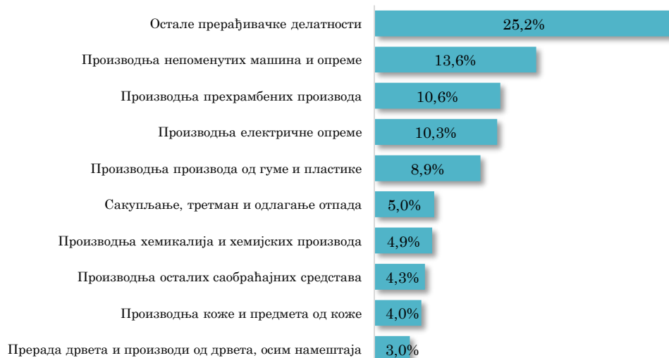
Водеће делатности у извозу АП Војводине у Словенију, јануар - март 2023. (кумулативно учешће 89,7% у укупном војвођанском извозу у Словенију)

Посматрано по областима делатности, највеће учешће у извозу АП Војводине у Словенију имају управо области прерађивачке индустрије, и то пре свега Остале прерађивачке делатности (25,2% укупног војвођанског извоза у Словенију у прва три месеца 2023. године) , затим Производња непоменутих машина и опреме (13,6%) , Производња прехранбених производа (10,6%) и Производња електричне опреме (10,3%) . У групи од првих десет области делатности у извозу АП Војводине у Словенију, осим области прерађивачке индустрије, истиче се и Сакупљање, третман и одлагање отпада (5,0% укупног војвођанског извоза у Словенију у посматраном периоду).