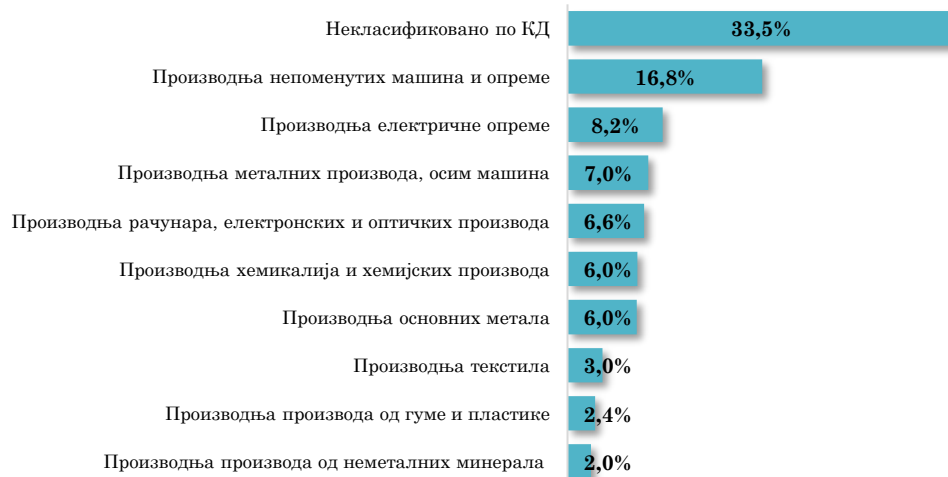
Водеће делатности у увозу АП Војводине из Кине, јануар - јул 2023. (кумулативно учешће 91,7% у укупном војвођанском увозу из Кине)

Посматрано по артиклима, у периоду јануар - јул 2023. године из Кине у Војводину је највише увезено (поред Неразврстане робе по ЦТ) Машина за обраду гуме или пластичне масе, осталих , у вредности од 26,9 млн евра, са учешћем од 4,3% у укупном увозу из Кине (односно учешћем од 83,7% у укупном војвођанском увозу датог артикла у посматраном периоду). Остали увозни производи појединачно учествују са мање од по 3,0% у укупном увозу АП Војводине из Кине.