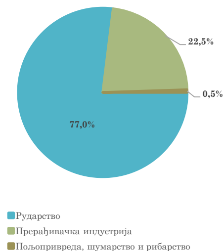
Структура извоза Републике Србије у Народну Републику Кину, јануар - јул 2023.