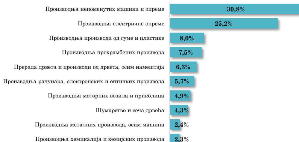
Водеће делатности у извозу АП Војводине у Кину, јануар - јул 2023. (кумулативно учешће 97,5% у укупном војвођанском извозу у Кину)

Посматрано по областима делатности, највеће учешће у извозу АП Војводине у Кину имају области прерађивачке индустрије, и то Производња непоменутих машина и опреме (30,8% укупног војвођанског извоза у Кину у првих седам месеци ове године) и Производња електричне опреме (учешће 25,2%) , које су, међутим, у односу на исти период прошле године забележиле смањење вредности извоза у Кину за 45,6% и 70,7%, респективно. У групи од првих десет области делатности у извозу АП Војводине у Кину, осим области прерађивачке индустрије, налази се и област пољопривреде, и то Шумарство и сеча дрвећа , која се налази на осмом месту, са учешћем од 4,3% у у периоду јануар - јул 2023. године, остваривши међугодишње смањење вредности извоза за 47,3%.