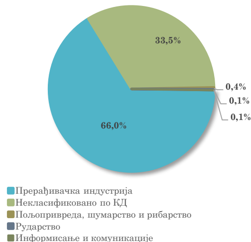
Структура увоза АП Војводине из Кине, јануар - јул 2023. године

Посматрано по областима делатности, у увозу АП Војводине из Кине највеће учешће има област Некласификовано по КД (33,5% у првих седам месеци 2023. године, остваривши међугодишњи раст увоза од 33,3%) , следе Производња непоменутих машина и опреме (учешће 16,8%, уз међугодишњи пад од 17,4%) и Производња електричне опреме (учешће 8,2%, уз међугодишње смањење од 14,8%) .