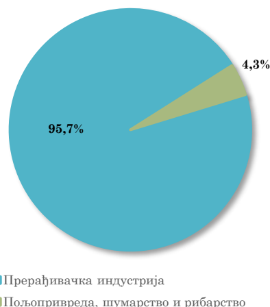
Структура извоза АП Војводине у Народну Републику Кину, јануар - јул 2023.

Посматрано по областима делатности, највеће учешће у извозу АП Војводине у Кину имају области прерађивачке индустрије, и то Производња непоменутих машина и опреме (30,8% укупног војвођанског извоза у Кину у првих седам месеци ове године) и Производња електричне опреме (учешће 25,2%) , које су, међутим, у односу на исти период прошле године забележиле смањење вредности извоза у Кину за 45,6% и 70,7%, респективно. У групи од првих десет области делатности у извозу АП Војводине у Кину, осим области прерађивачке индустрије, налази се и област пољопривреде, и то Шумарство и сеча дрвећа , која се налази на осмом месту, са учешћем од 4,3% у у периоду јануар - јул 2023. године, остваривши међугодишње смањење вредности извоза за 47,3%.