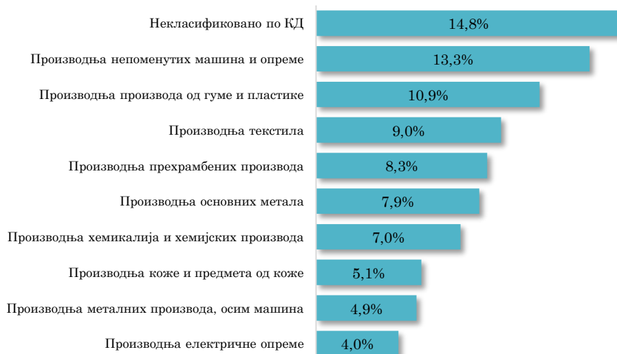
Водеће делатности у увозу АП Војводине из Италије, јануар - септембар 2023. (кумулативно учешће 85,2% у укупном увозу из Италије)

Посматрано по областима делатности, у увозу АП Војводине из Италије, у првих девет месеци ове године, највеће учешће има област Некласификовано по КД (чини 14,8% укупног војвођанског увоза из Италије, а повећан је за 40,4% мг.). Следе области прерађивачке индустрије, и то, Производња непоменутих машина и опреме (учешће 13,3%), Производња производа од гуме и пластике (10,9%), Производња текстила (9,0%) и Производња прехранбених производа (8,3%).