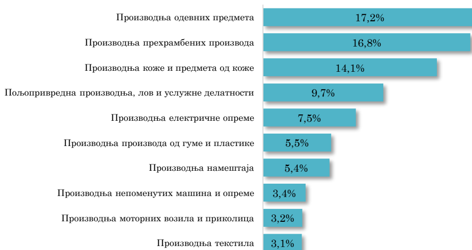
Водеће делатности у извозу АП Војводине у Италију, јануар - септембар 2023. (кумулативно учешће 86,0% у укупном извозу у Италију)

Посматрано по областима делатности, највеће учешће у извозу АП Војводине у Италију имају управо области прерађивачке индустрије, и то Производња одевних предмета (17,2% укупног војвођанског извоза у Италију), затим Производња прехранбених производа (16,8%) и Производња коже и предмета од коже (14,1%). У групи од првих десет области делатности по вредности оствареног извоза у Италију, осим области прерађивачке индустрије, налази се и област пољопривреде, односно Пољопривредна производња, лов и услужне делатности , која се налази на четвртном месту, са учешћем од 9,7% у укупном војвођанском извозу у Италију у периоду јануар - септембар 2023. године.