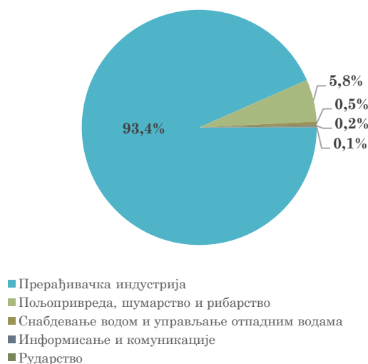
Структура извоза Србије у Италију, јануар - септембар 2023.