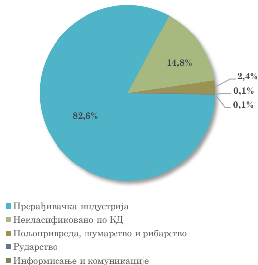
Структура увоза АП Војводине из Италије, јануар - септембар 2023.

Посматрано по областима делатности, у увозу АП Војводине из Италије, у првих девет месеци ове године, највеће учешће има област Некласификовано по КД (чини 14,8% укупног војвођанског увоза из Италије, а повећан је за 40,4% мг.). Следе области прерађивачке индустрије, и то, Производња непоменутих машина и опреме (учешће 13,3%), Производња производа од гуме и пластике (10,9%), Производња текстила (9,0%) и Производња прехранбених производа (8,3%).