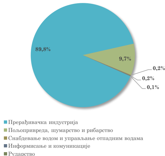
Структура извоза АП Војводине у Италију, јануар - септембар 2023.

Посматрано по областима делатности, највеће учешће у извозу АП Војводине у Италију имају управо области прерађивачке индустрије, и то Производња одевних предмета (17,2% укупног војвођанског извоза у Италију), затим Производња прехранбених производа (16,8%) и Производња коже и предмета од коже (14,1%). У групи од првих десет области делатности по вредности оствареног извоза у Италију, осим области прерађивачке индустрије, налази се и област пољопривреде, односно Пољопривредна производња, лов и услужне делатности , која се налази на четвртном месту, са учешћем од 9,7% у укупном војвођанском извозу у Италију у периоду јануар - септембар 2023. године.