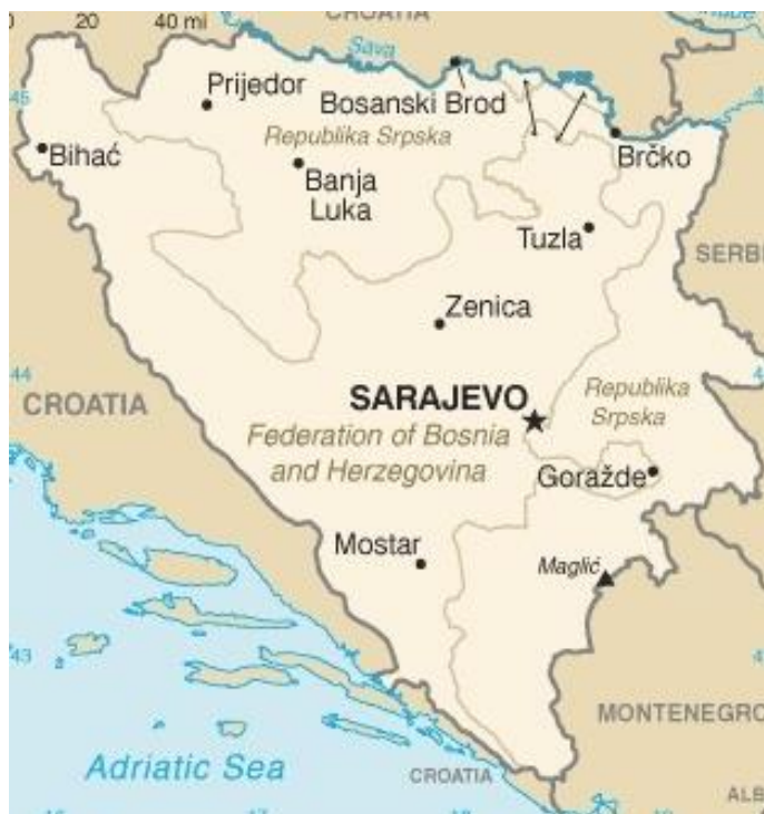
Босна и Херцеговина